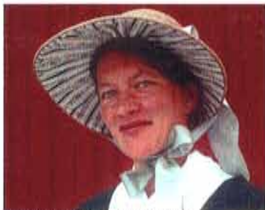
Øverst lue, nederst hatt.

Vi har ikke utviklet mye sølv til drakten. Vi anbefaler en enkel serkering til serken, men har også satt i produksjon en hjertenål med fugler en type som ofte er funnet på Østlandet. Til å lukke spenceren har vi to store nåler med sølvhode som er lenket sammen. Tidligere brukte man ofte bare knappenåler til å lukke spencerjakkene med. En nøstekrok i sølv, gjerne med monogram eller navn og dato er et valgfritt tilbehør som mange skaffer seg. Nøstekroken var et nyttig redskap som de fleste brukte når de gikk og strikket.