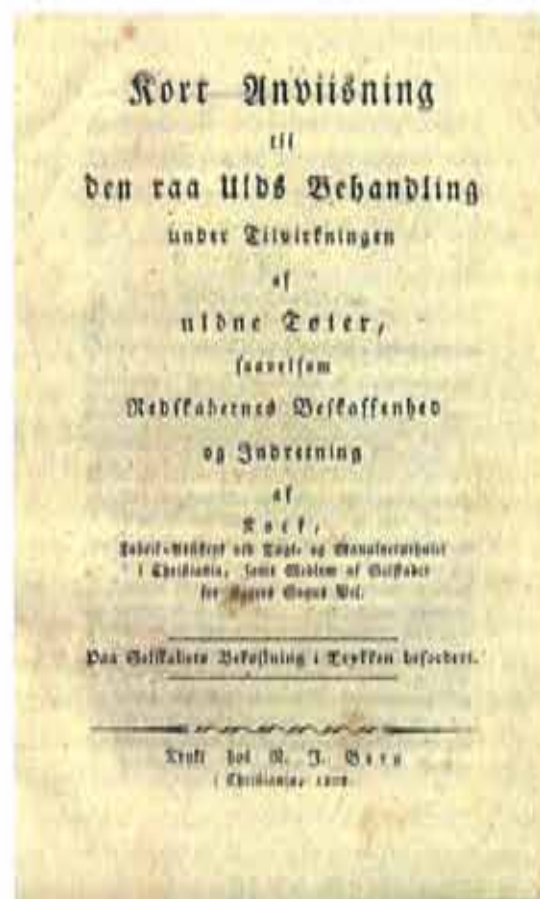
«Kort anviisning til den raa Ulds behandling».

Her er det gengitt en side fra publikasjonen «Plan», med eksempler på priser.