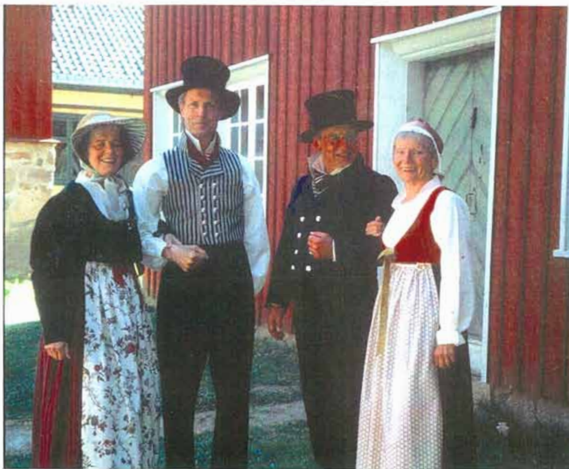
Akerdrakten, kvinne- og mansdrakt.

i prøvevevingen, men gjorde det mulig for oss å gjennomføre prosjektet.